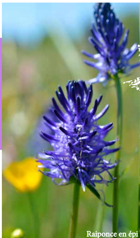
Raiponce en épi